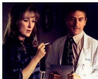
1996 SIMPLES SECRETS (Marvin's Room) de Jerry Zaks avec Meryl Streep