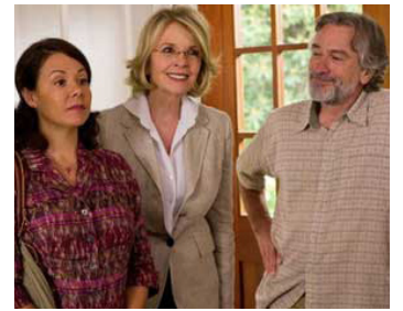
2013 UN GRAND MARIAGE (The Big Wedding) de Justin Zackham avec Diane Keaton