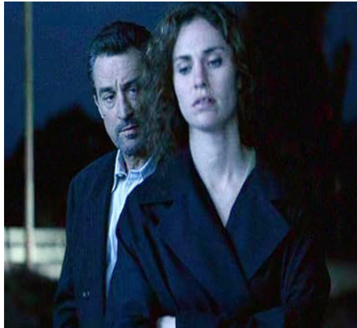
1995 HEAT (Heat) de Michael Mann avec Amy Brenneman