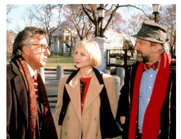
1997 DES HOMMES D'INFLUENCE (Wag the Dog) de B. Levinson avec D. Hoffman, Anne Heche