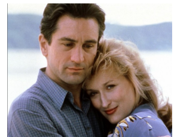
1984 FALLING IN LOVE (Falling in Love) d'Ulu Grosbard avec Meryl Streep