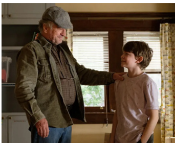
2020 MON GRAND-PÈRE ET MOI (The War with Grandpa) de Tim Hill avec Oake Fegley