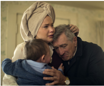
2015 JOY (Joy) de David O. Russell avec Jennifer Lawrence