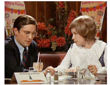
1970 LES NUITS DE NEW YORK (Hi, Mom !) de Brian de Palma avec Jennifer Salt