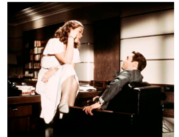
1976 LE DERNIER NABAB (The last Tycoon) d'Elia Kazan avec Theresa Russell