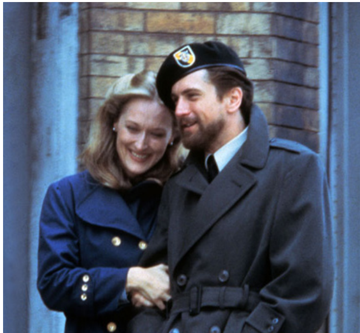
1978 VOYAGE AU BOUT DE L'ENFER (The Deer Hunter) de Michael Cimino avec Meryl Streep