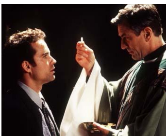
1996 SLEEPERS (Sleepers) de Barry Levinson avec Jason Patric