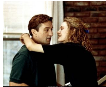
1993 MAD DOG & GLORY (Mad Dog and Glory) de John McNaughton avec Uma Thurman