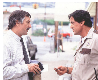
1996 COPLAND (Copland) de James Mangold avec Sylvester Stallone