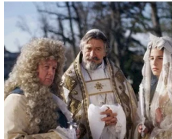
2003 LE PONT DU ROI SAINT-LOUIS (The Bridge of San Luis Rey) de M. McGuckian avec P. Lopez