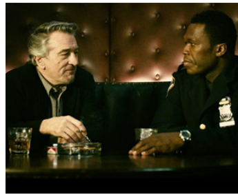
2012 UNITÉS D'ÉLITE (Freelancers) de Jessy Terrero avec Fifty Cents