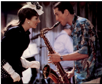
1977 NEW YORK, NEW YORK de Martin Scorsese avec Liza Minnelli