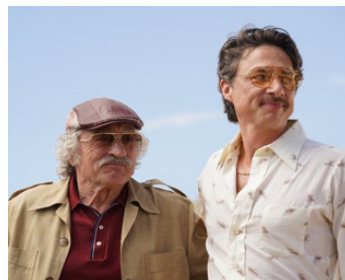
2020 ARNAQUE À HOLLYWOOD (The Comeback Trail) de George Gallo avec Zach Braff