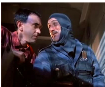
1985 BRAZIL (Brazil) de Terry Gilliam avec Jonathan Pryce