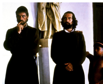
1986 MISSION (The Mission) de Roland Joffé avec Jeremy Irons