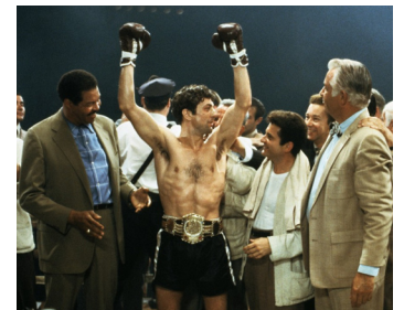
1979 RAGING BULL (Raging Bull) de Martin Scorsese avec Joe Pesci