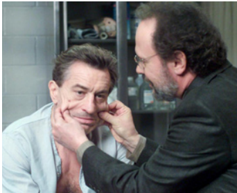
2002 MAFIA BLUES 2, LA RECHUTE (Analyse That) d'Harold Ramis avec Billy Crystal