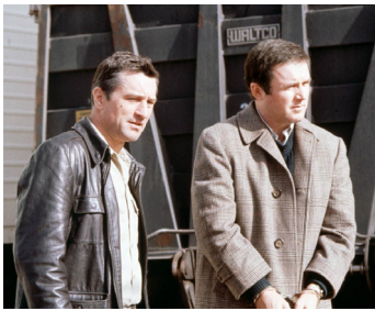
1988 MIDNIGHT RUN (Midnight Run) de Martin Brest avec Charles Grodin