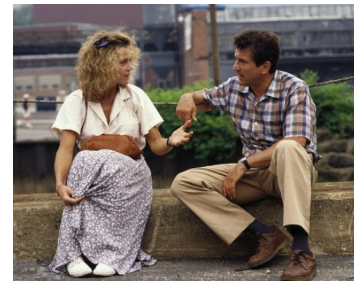
1990 STANLEY ET IRIS (Stanley & Iris) de Martin Ritt avec Jane Fonda