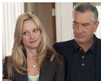
2010 MON BEAU-PÈRE ET NOUS (Little Flockers) de Paul Weitz avec Teri Polo