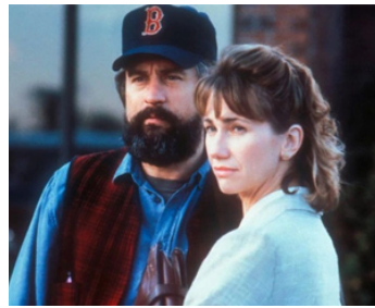
1989 JACKNIFE (Jacknife) de David Jones avec Kathy Baker