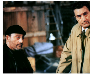
1998 RONIN (Ronin) de John Frankenheimer avec Jean Reno