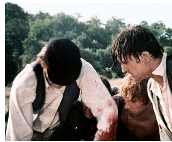
1970 BLOODY MAMA (Bloody Mama) de Roger Corman