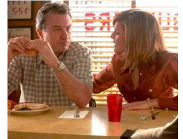
2002 SHOWTIME (Showtime) de Tom Dey avec Rene Russo