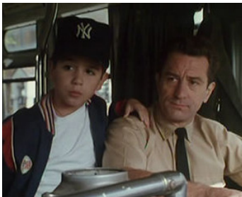
1993 IL ÉTAIT UNE FOIS LE BRONX (A Bronx's Tale) de Robert De Niro avec Francis Capra