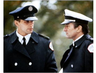
1991 BACKDRAFT (Backdraft) de Ron Howard avec William Baldwin