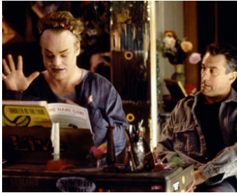
1999 PERSONNE N'EST PARFAIT(E) (Flawless) de Joel Schumacher avec Ph. Seymour Hoffman