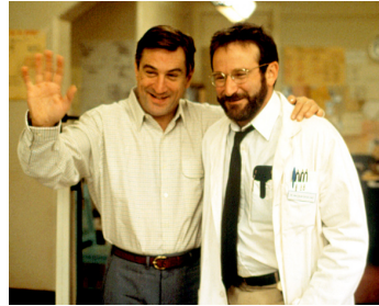
1990 L'ÉVEIL (Awakenings) de Penny Marshall avec Robin Williams