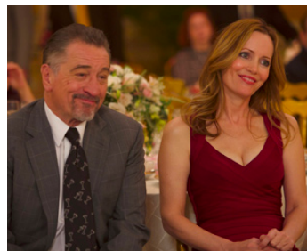
2016 THE COMEDIAN (The Comedian) de Taylor Hackford avec Leslie Mann