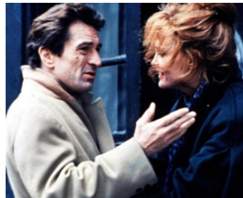
1992 LA LOI DE LA NUIT (Night and the City) d'Irwin Winkler