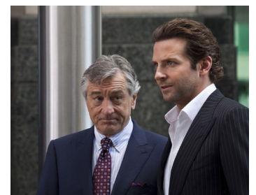
2011 LIMITLESS (Limitless) de Neil Burger avec Bradley Cooper