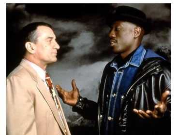
1996 LE FAN (The Fan) de Tony Scott avec Wesley Snipes