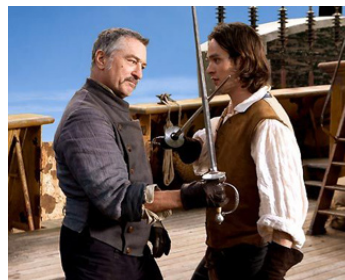
2007 STARDUST, LE MYSTÈRE DE L'ÉTOILE (Stardus) de M. Vaughn avec Henry Cavill