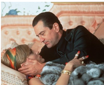
1995 CASINO (Casino) de Martin Scorsese avec Sharon Stone