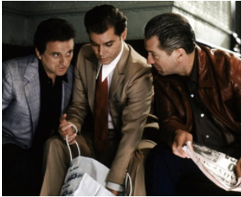
1990 LES AFFRANCHIS (Goodfellas) de Martin Scorsese avec Joe Pesci, Ray Liotta