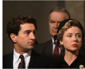
1991 LA LISTE NOIRE (Guilty by Suspicion) d'Irwin Winkler avec Annette Bening