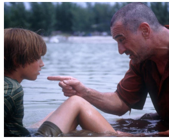
1997 DE GRANDES ESPÉRANCES (Great Expectations) d'Alfonso Cuaron avec J. J. Kissner