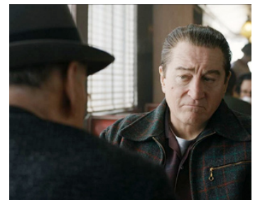
2019 THE IRISHMAN (The Irishman) de Martin Scorsese avec Paul Herman