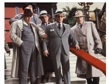
1986 LES INCORRUPTIBLES (The Untouchables) de Brian de Palma