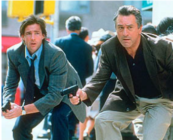
2000 15 MINUTES (Fifteen Minutes) de John Herzfeld avec Edward Burns