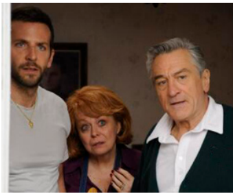
2012 HAPPINESS THERAPY (Silver Linings Playbook) de David O. Russell avec Br. Cooper, Jacki Weaver