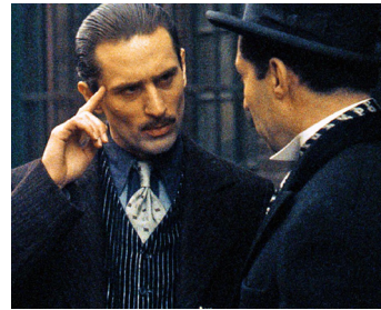
1974 LE PARRAIN 2 (The Godfather, part 2) de Francis Ford Coppola