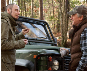
2013 FACE À FACE (Killing Season) de Mark Steven Johnson avec John Travolta