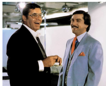
1983 LA VALSE DES PANTINS (King of Comedy) de Martin Scorsese avec Jerry Lewis