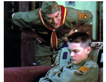
1993 BLESSURES SECRÈTES (This Boy's Life) de M. Caton-Jones avec Leonardo Di Caprio