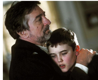
2004 GODSEND, EXPÉRIENCE INTERDITE (Godsend) de Nick Hamm avec Cameron Bright