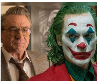
2019 JOKER (Joker) de Todd Phillips avec Joaquin Phoenix