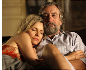
2013 MALAVITA (The Family) de Luc Besson avec Michelle Pfeiffer