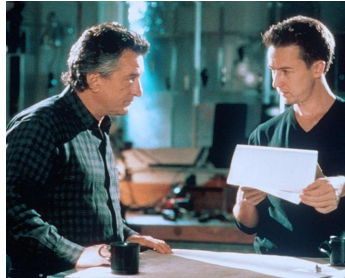
2001 THE SCORE (The Score) de Frank Oz avec Edward Norton