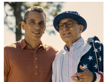
2023 MON PÈRE ET MOI (About my Father) de Laura Terruso avec Sebastian Maniscalco