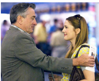
2009 EVERYBODY'S FINE de Kirk Jones avec Drew Barrymore