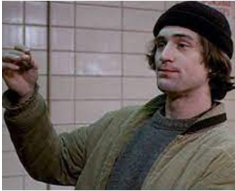
1971 NÉ POUR VAINCRE (Born to win) d'Ivan Passer