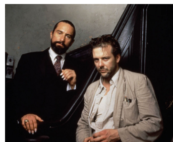
1986 ANGEL HEART (Angel Heart) d'Alan Parker avec Mickey Rourke