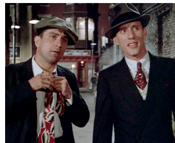
1984 IL ÉTAIT UNE FOIS EN AMÉRIQUE (Once upon a time in America) de S. Leone avec James Woods