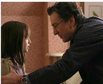
2004 TROUBLE JEU (Hide and Seek) de John Polston avec Dakota Fanning