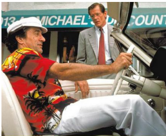
1991 LES NERFS À VIF (Cape Fear) de Martin Scorsese avec Nick Nolte