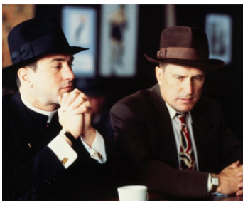
1981 SANGLANTE CONFESIONS (True Confessions) d'Ulu Grosbard avec Robert Duvall