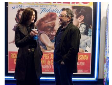
2008 PANIQUE À HOLLYWOOD (What Just Happened ?) de B. Levinson avec C. Keener