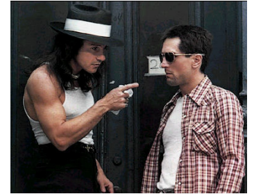
1975 TAXI DRIVER (Taxi Driver) de Martin Scorsese avec Harvey Keitel