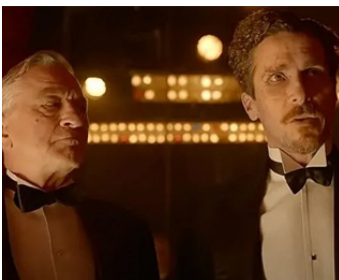
2022 AMSTERDAM (Amsterdam) de David O. Russell avec Christian Bale