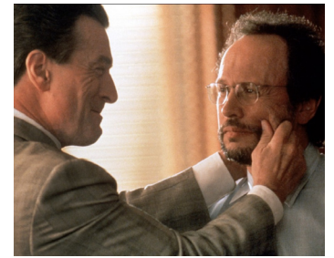
1998 MAFIA BLUES (Analyse this) de Harold Ramis avec Billy Crystal