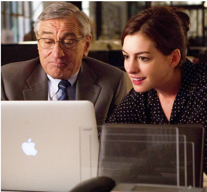
2015 LE NOUVEAU STAGIAIRE (The Intern) de Nancy Meyers avec Anne Hathaway