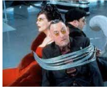
2000 ROCKY ET BULLWINKLE de Don McAnuff avec Rene Russo, Jason Alexander