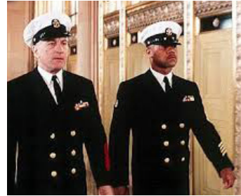
1999 LES CHEMINS DE LA DIGNITÉ (Men of Honor) de G. Tillman Jr avec Cuba Gooding