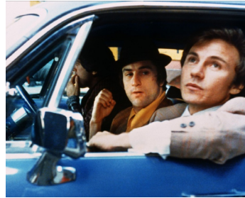
1973 MEAN STREETS (Mean Streets) de Martin Scorsese avec Harvey Keitel