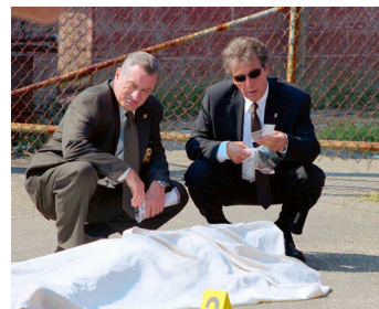
2008 LA LOI ET L'ORDRE (Righteous Kill) de Jon Avnet avec Al Pacino