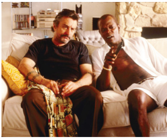
1997 JACKIE BROWN (Jackie Brown) de Quentin Tarentino avec Samuel L. Jackson