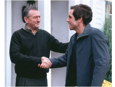
2000 MON BEAU-PÈRE ET MOI (Meet the Parents) de Jay Roach avec Ben Stiller