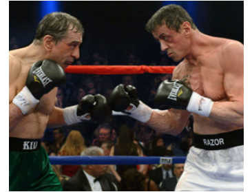
2014 MATCH RETOUR (Grudge Match) de Peter Segal avec Sylvester Stallone