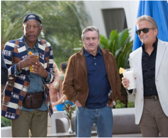
2013 LAS VEGAS (Las Vegas) de Jon Turteltaub avec Morgan Freeman, Michael Douglas