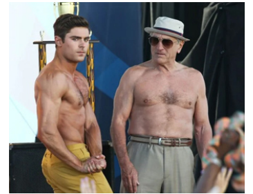
2016 DIRTY PAPY (Dirty Grandpa) de Dan Mazer avec Zac Efron