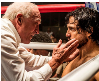
2016 HANDS OF STONE de Jonathan Jakubowicz avec Edgar Ramirez