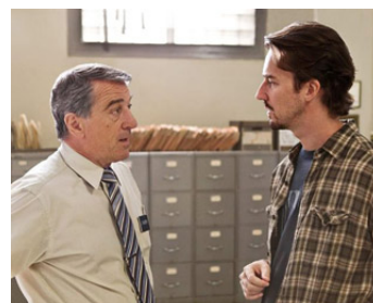
2011 STONE (Stone) de John Curran avec Edward Norton