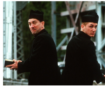
1989 NOUS NE SOMMES PAS DES ANGES (We're no Angels) de Neil Jordan avec Sean Penn