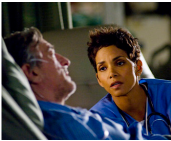
2011 HAPPY NEW YEAR (New Year's Eve) de Garry Marshall avec Halle Berry