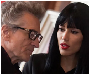
2014 L'INSTINCT DE TUER (The Bag Man) de David Grovic avec Rebecca De Costa