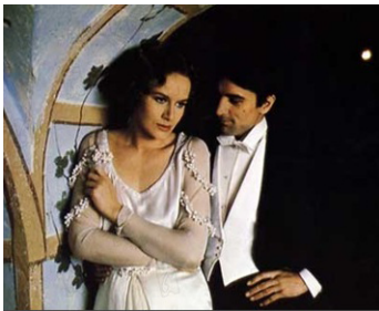
1975 1900 (Novecento) de Bernardo Bertolucci avec Dominique Sanda